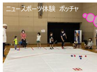
ニュースポーツ体験 ポッチャ

小体育室では卓球開放とニュースポーツ体験を実施しました。ニュースポーツはポッチャ、ファミリーバドミントン、ドローンサッカーを体験しました。