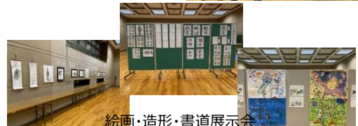
絵画・造形・書道展示会