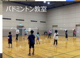
バドミントン教室