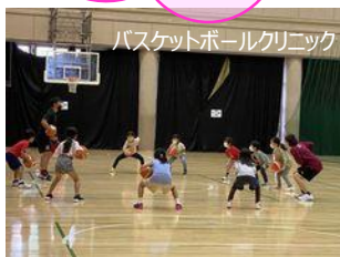
バスケットボールクリニック