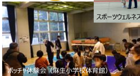
ポッチャ体験会 (麻生小学校体育館)