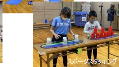
スポーツスタッキング