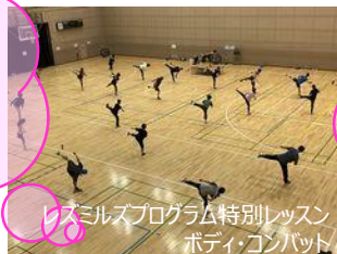
レズミズプログラム特別レッスン ボディコンバット

10月10日(月)はスポーツの日記念事業イベントを開催しました。当日は500名を超える方に参加いただきました。大体育室ではレズミズプログラム特別レッスン、バスケットボールクリニック、バドミントン開放で盛り上がりました。