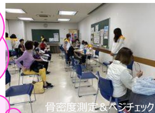
骨密度測定 & ベジチェック

研修室では骨密度測定とベジチェック、2階フロアではInbody測定会を実施しました。年齢性別問わず大好評でした！ 第一武道室、第二武道室では武道を体験。空手体験会、柔道体験会を実施しました。